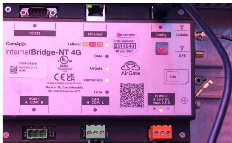
Figuur 4: InternetBridge