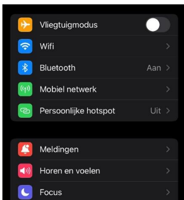
Figuur 1: Stap 2.1