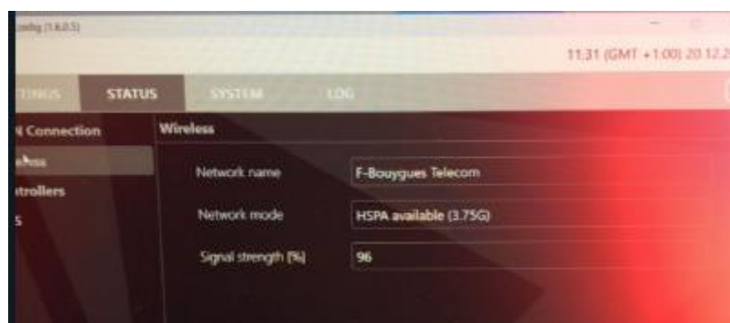
Figuur 6: : Screenshot IB-NT Config, Status, Wireless