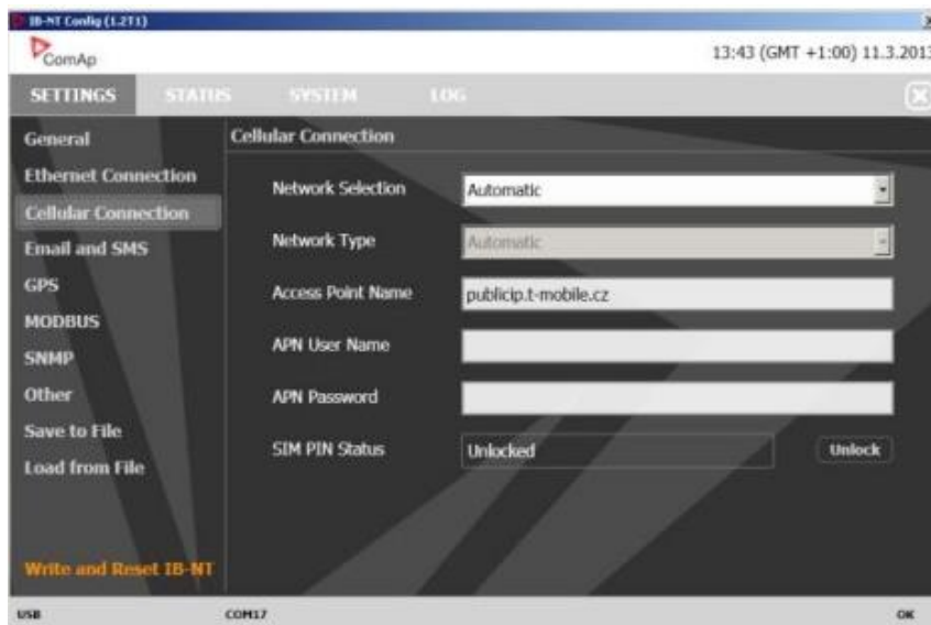
Figuur 5: Screenshot IB-NT Config, Setting, Cellular Connection